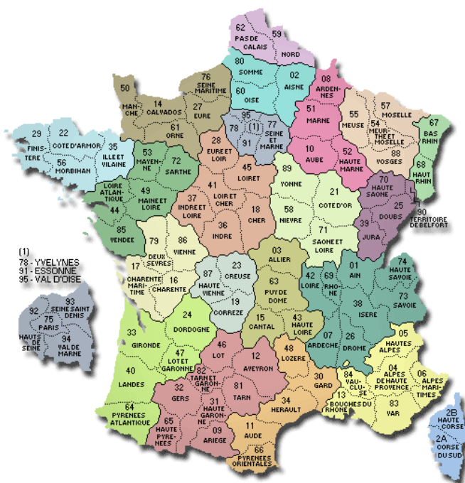
Carte interactive des départements Français métropolitains Carte de France - Département

Il a été décidé par le BE de la FFC, de demander aux CR concernés de faire une proposition à la FFC, sur leurs départements concernés par ces accords frontaliers.